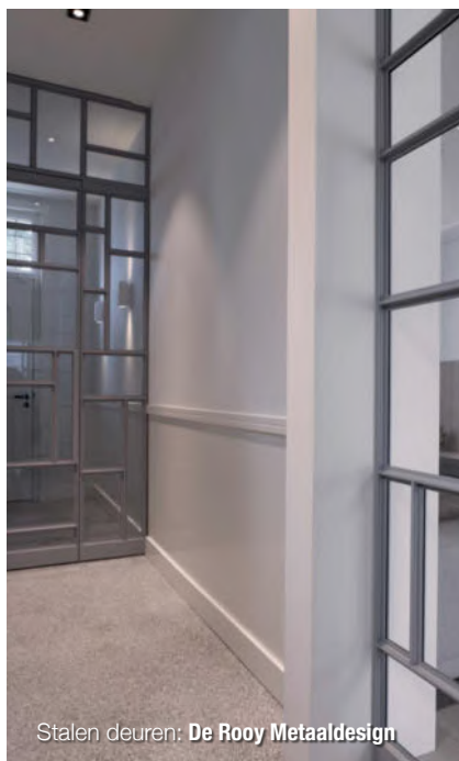
Stalen deuren: De Rooy Metaaldesign

“Alle schakeringen aan tinten grijs zijn precies op elkaar afgestemd.”