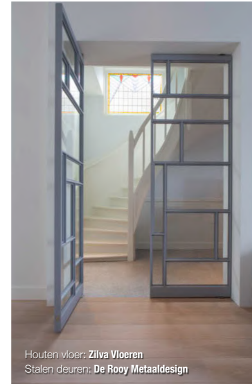
Houten vloer: Zilva Vloeren Stalen deuren: De Rooy Metaaldesign