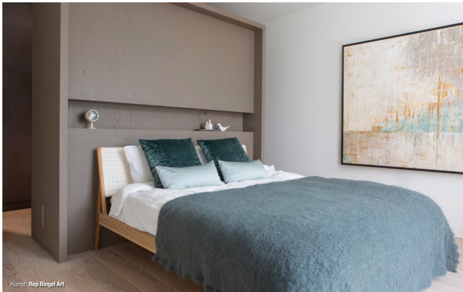
Kunst: Rep Ringel Art

als het even kan creëer ik zo'n tussenruimte waar je een keuze hebt welke kant je uitgaat", legt Remy uit. Tegenover de bank ontwierp de interieurarchitect een stoer betonnen hardplateau. Het tapijt bij de bank blijkt op een bijzonder landschapsperspectief gebaseerd te zijn. "Ik deed inspiratie op tijdens een ballonvaart boven het Toscaanse landschap. De lijnen van de akkers en de opkomende plantjes heb ik vertaald in de lijnen en toefjes garen in het tapijt." Net als in de meeste ruimtes, ligt er een wit ingewassen eikenhouten vloer van brede planken in de woonkamer. De enige meubelstukken die niet uit Remy's collectie komen, zijn de eetkamerstoelen aan de grijs gebeitste eikenhouten eettafel.