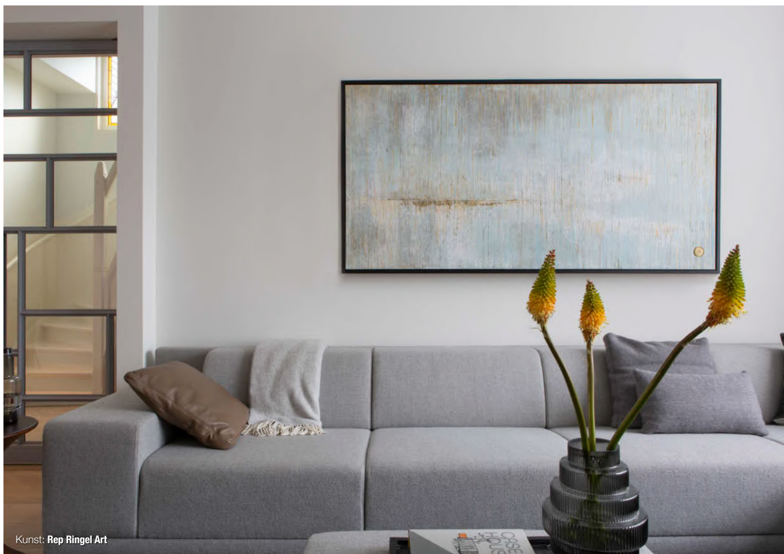
Kunst: Rep Ringel Art