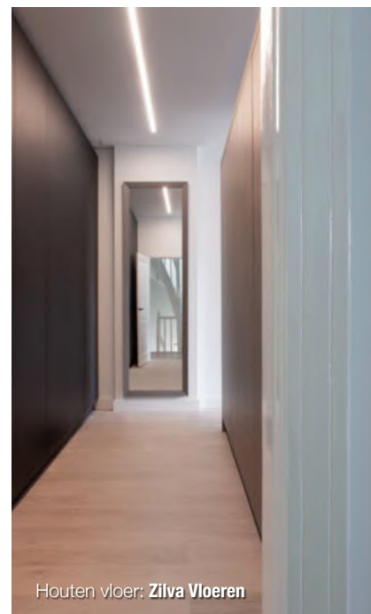
Houten vloer: Zilva Vloeren